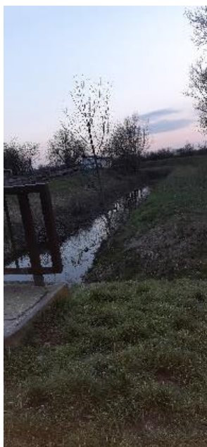
Lévai Klaudia Okorág